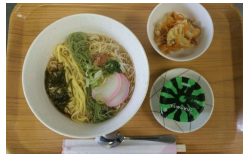
☆. . . : * ° ☆七夕メニュー☆. . . : * °

栄養課では七夕の日にちなんで、色とりどりの麺が入った七夕そうめん、夏らしいスイカゼリーを提供しています。