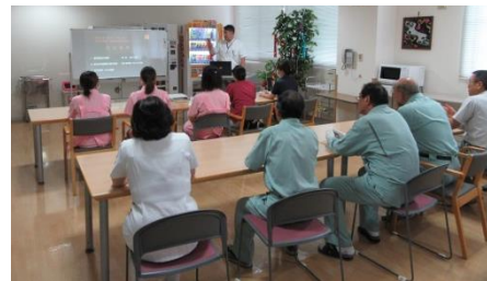
防火管理者による防災教育の様子

災害発生時における行動確認・関係機関および住民・企業等と協体制の強化を目的とした、各種の災害を想定した訓練を実施いたしました。