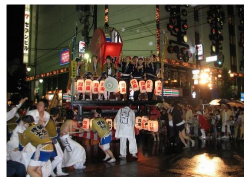
旭川市では烈夏七夕まつりが開催されます☆彡