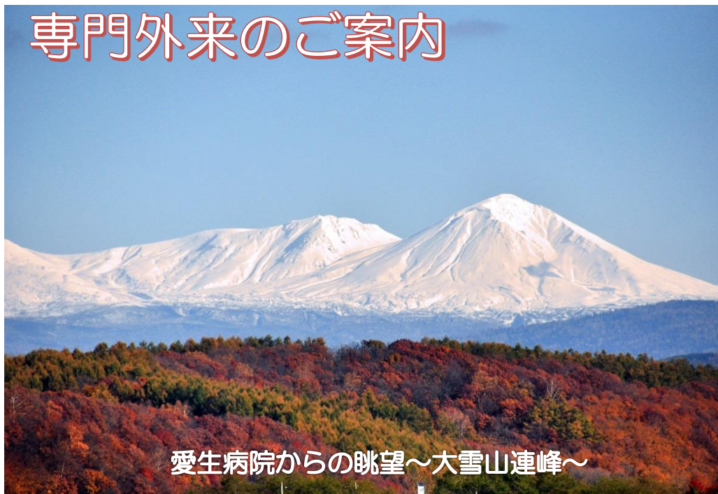
愛生病院からの眺望～大雪山連峰～