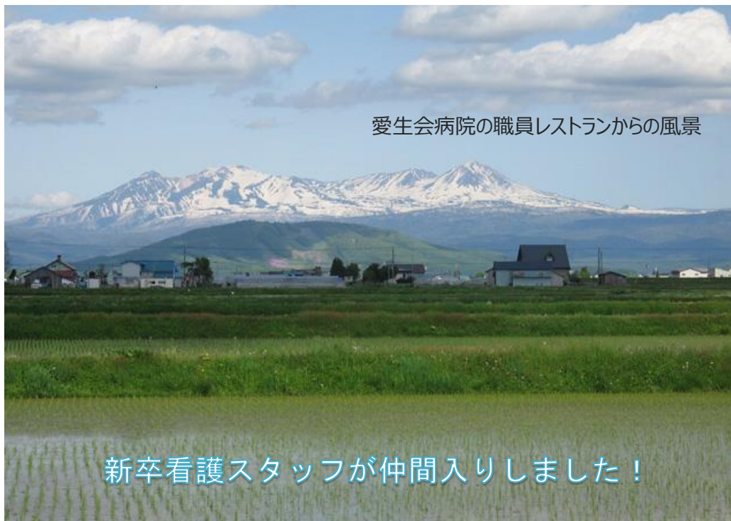
愛生会病院の職員レストランからの風景