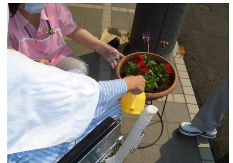
写真.水やりをしている様子

プランターをスタッフと患者さまで囲み、スタッフが花の苗を植え、患者さまにジョウロで水をあげていただきました。皆さん明るい表情でスタッフが花を植えるのを、ニコニコしながら眺めていました。植え終わると自らバケツの水を何度も何度もすくい、一生懸命お水をあげている様子もありました。とても微笑ましい風景で、和やかな楽しいひと時を過ごすことができ、思い出に残るレクリエーションとなりました。