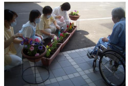
写真 楽しく会話しながら植えている様子

また、普段みられない患者さまの明るい笑顔と真剣に取り組む姿に、ご覧になっていたご家族さまにも大変喜んで頂けました。「水やりはどうするの？誰かするの？」と花が枯れてしまう事を心配されていた患者さまの為に丹精込めて植えた花を大切に育てていきたいと思ひます。とても小さな花壇ですが、患者さまの様々な思いを込めて植えられた花達が