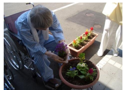
写真 真剣に植えている様子

その美を競うかのように咲き誇っておりますので、外来受診やお見舞いにお越しの際には是非、足を止めてご観賞下さい。