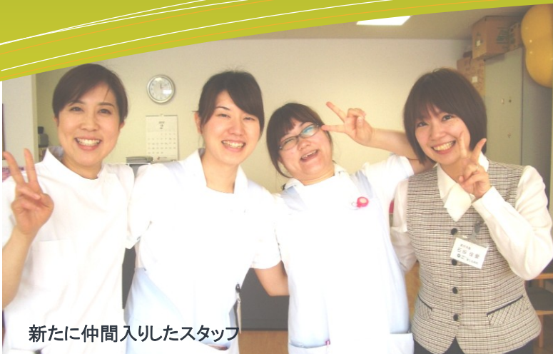
新たに仲間入りしたスタッフ